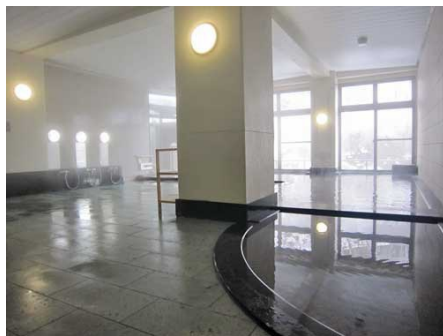
日が差し込む温泉大浴場