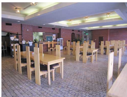
レストラン「ソレイユ」