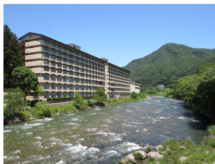
真横には利根川が流れる