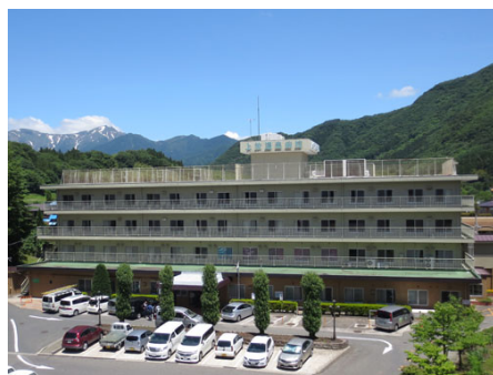
隣接した温泉病院