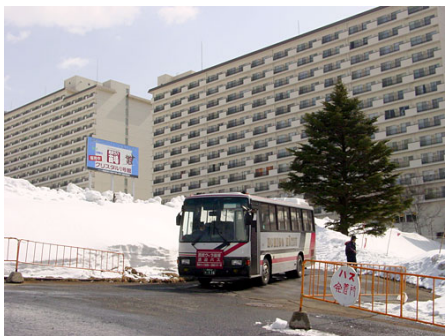
苗場スキー場行シャトルバス