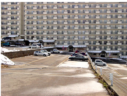
共用駐車場 (5・6号館前)