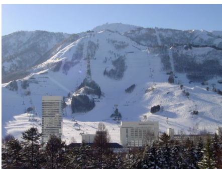
シャトルバスが出る苗場スキー場