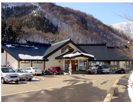
車で約15分の温泉施設「宿場の湯」