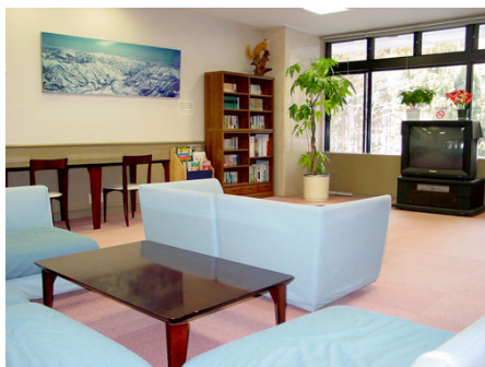
コミュニケーションルーム