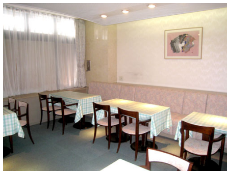
パーティールーム