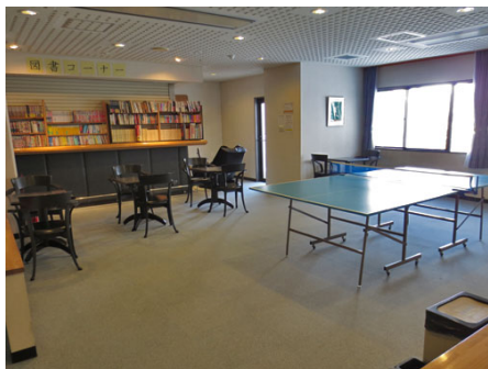
卓球台と図書コーナー