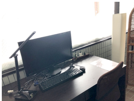
テレワークスペース