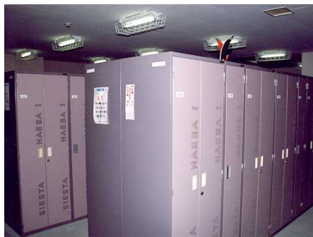
スキーロッカー室