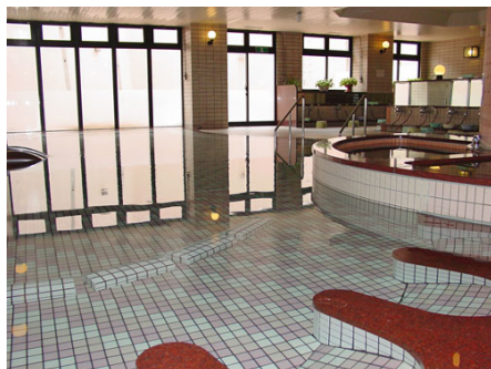
ジャグジー付き大浴場