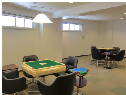
麻雀ルーム（全自動麻雀卓あり）