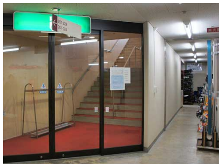
隣接したスキー場へのアプローチ