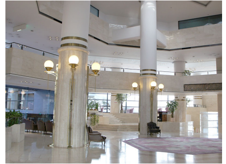
アトリウムロビー