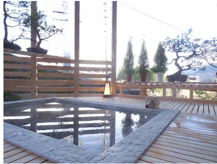
2020年新設の露天風呂