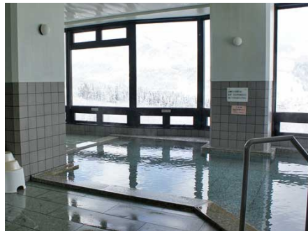
24時間営業の温泉大浴場