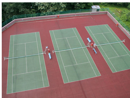
テニスコート（休止中）