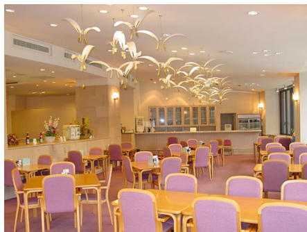
レストラン（通年営業）