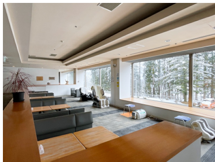
光が差し込むラウンジ