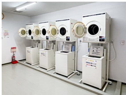
コインランドリー