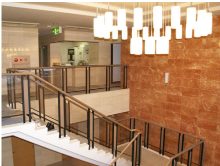
エントランスからフロントに通じる階段