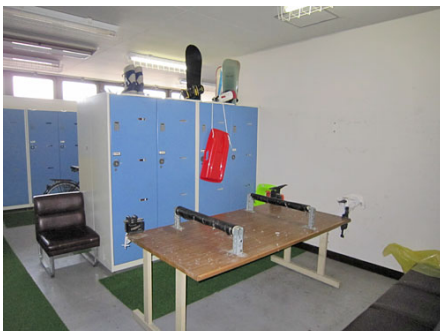
スキーロッカー (チューンナップコーナー付)