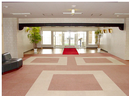
広々としたエントランスホール