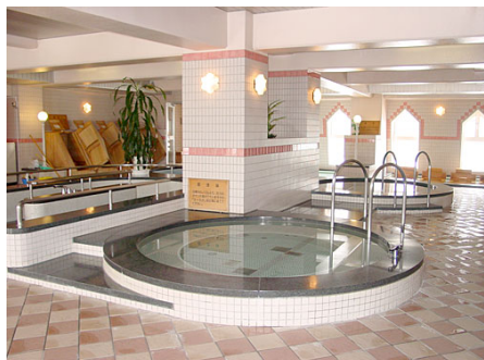
8種の浴槽を備えたフィットネススクア