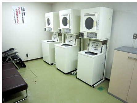
コインランドリー