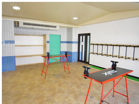
チェーンナップルーム