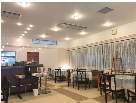
レストラン (1~3月の土日祝・年末年始のみ営業)