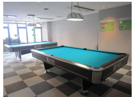
ビリヤードルーム