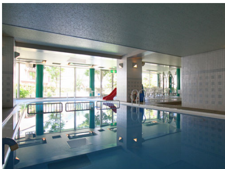
屋内10mプール (子供用もあり)