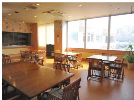
最上階のラウンジ