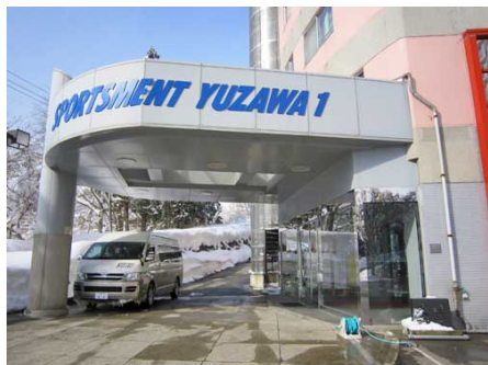
玄関前にはシャトルバスが待機