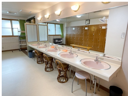
清潔感のある脱衣所