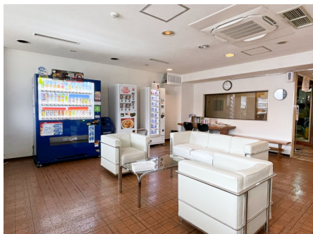
広々としたラウンジ