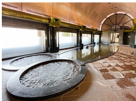
温泉大浴場（別途、家族風呂あり）