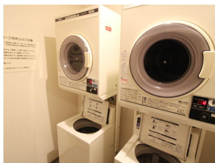
ランドリールーム