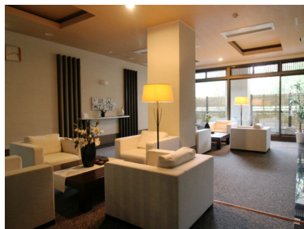
ホテルのようなエントランスロビー