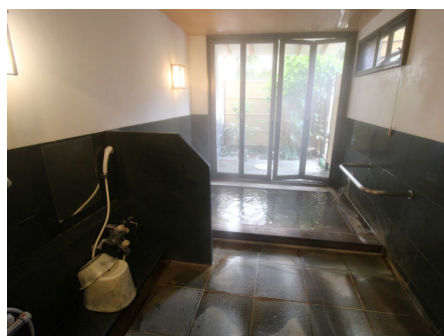
予約制の家族風呂