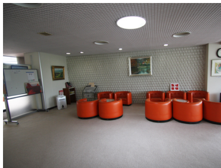
ラウンジスペース