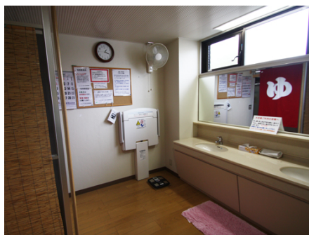
ベビー台付きの女性用脱衣所