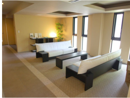
エントランスロビー