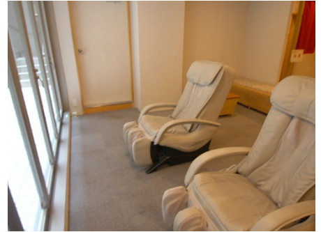
マッサージチェア