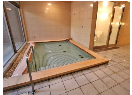
山麗の湯 湯殿「やまびこ」