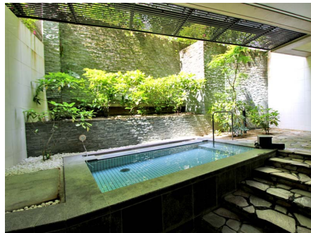
露天風呂「せせらぎ」