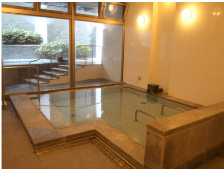
清流の湯 湯殿「せとお」