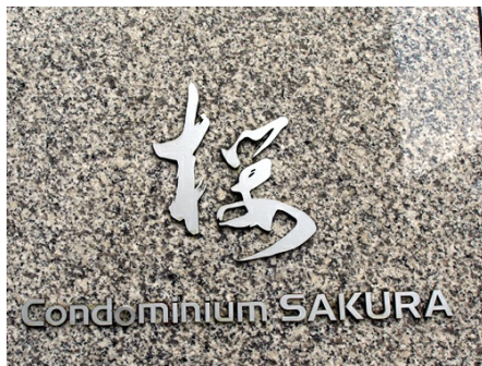
マンションエンブレム