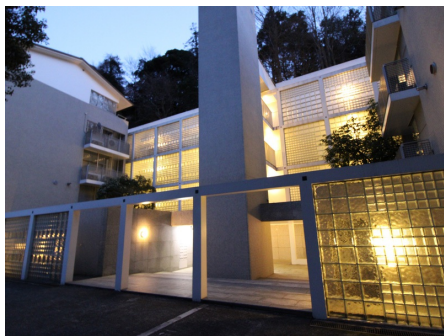
日が落ちてライトアップされた外観