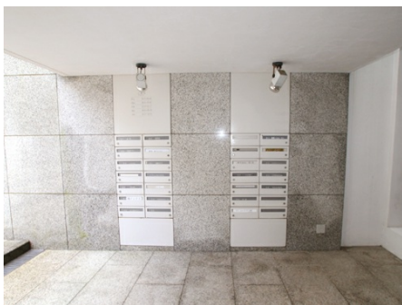
おしゃれな集合ポスト