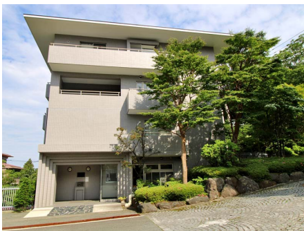
マンション外観（参番館）