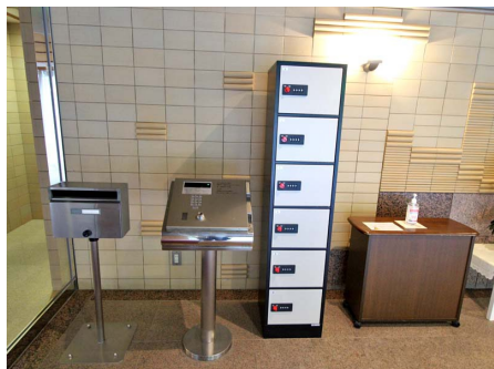
オートロックと宅配ボックス