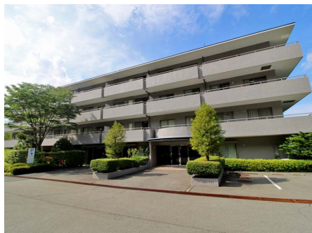
マンション外観（壱番館）