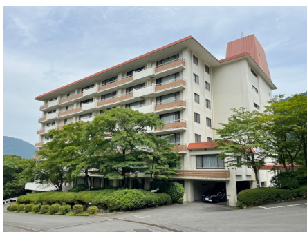
マンション外観 (フジタ第8)