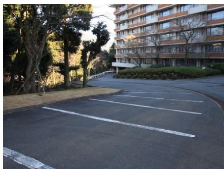
無料で使える駐車場