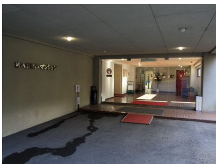
マンション入り口