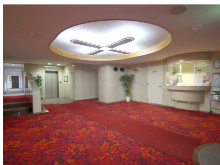
エレベーターホールと管理人室