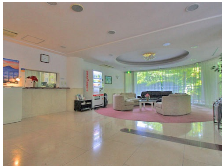
エントランスロビー