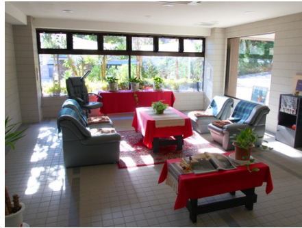
エントランスホール