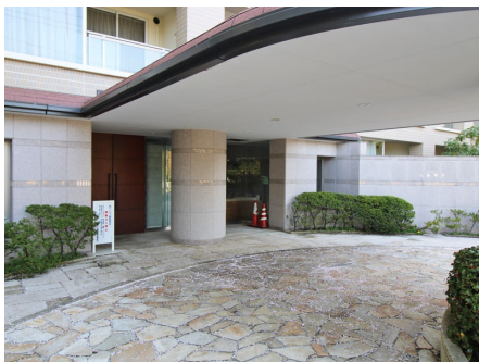
マンション入口の車寄せ