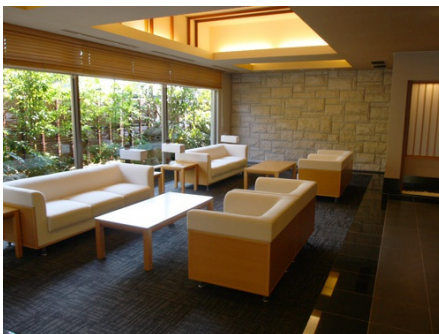
間接照明が優しいフロントロビー