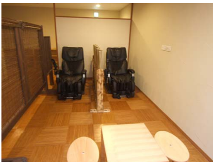
マッサージ機も癒やしのアイテム