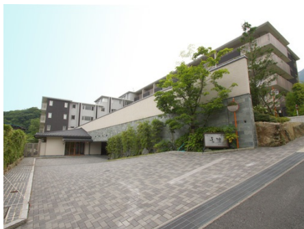
和のテイストが素敵な外観