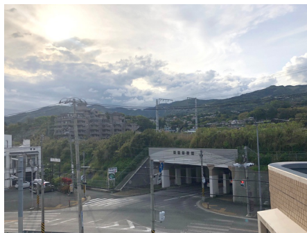
上層階からの眺望北西側