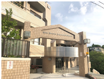
マンション入口(4階)