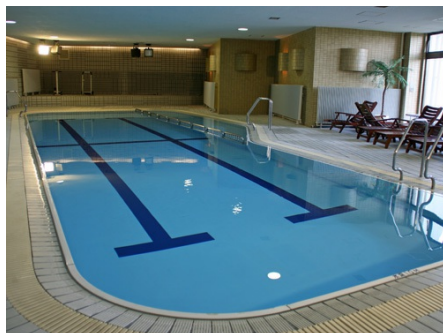
広々とした屋内プール