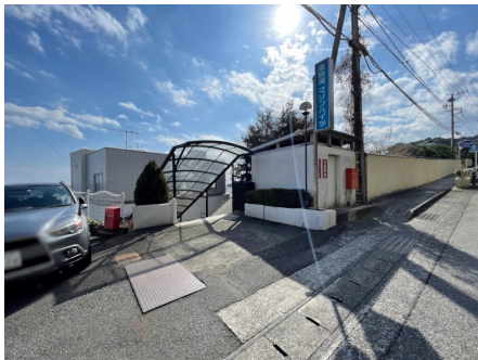
国道135号線沿いのマンション入口