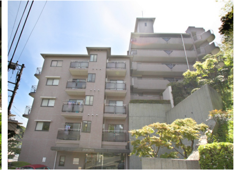
マンション入口側外観