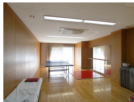
アスレチックルーム