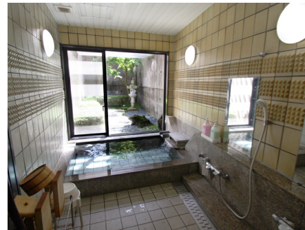
大浴場（温泉ではありません）