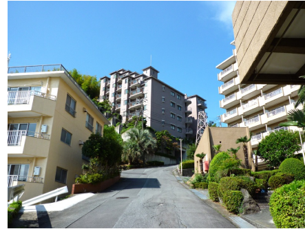
マンションまでの道