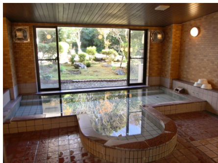
緑を眺める大浴場(沸かし湯)