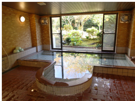
緑を眺める大浴場 (沸かし湯)