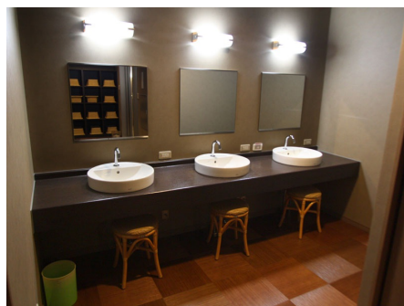
ドレッシングルーム