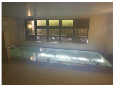
さつきの湯（大判タイル風呂）