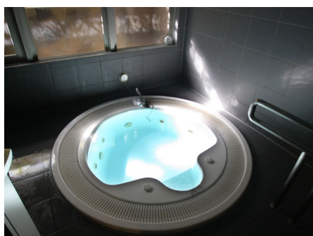
紅葉の湯（ジャグジー風呂）