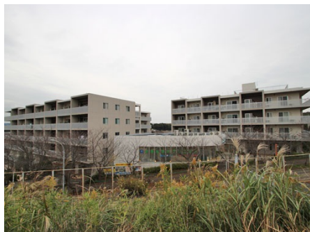
徒歩2分の京急三崎口駅