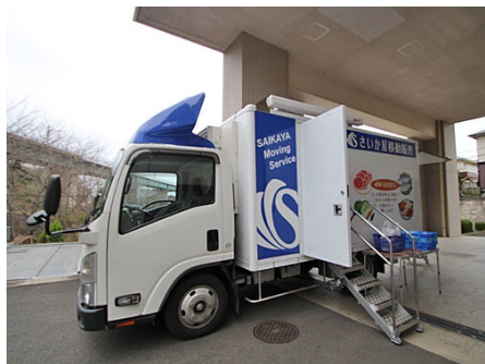
サービス付高齢者向け住宅とクリニックが併設