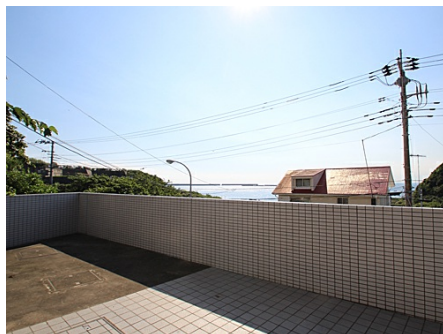
エントランスからは海を望む