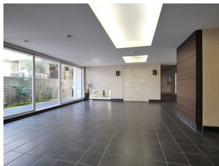
開放感のあるロビー