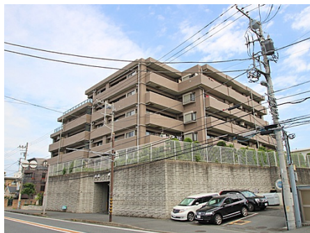
西側から見た外観