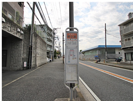
柳小路バス停が目の前