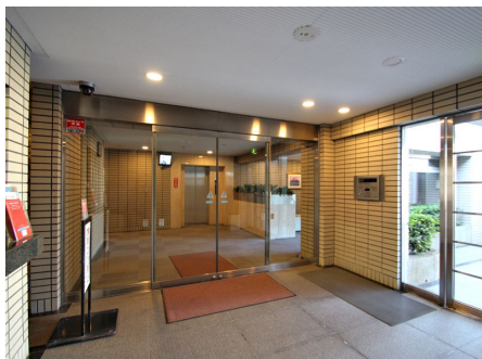
オートロック付き