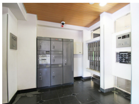
集合ポスト・宅配BOX