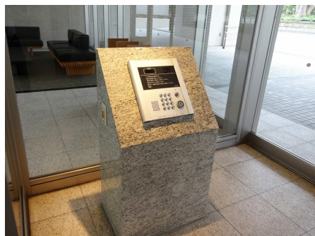
オートロック付き