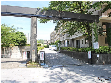
マンションの入口