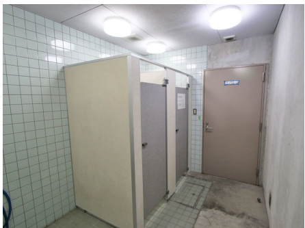
共用シャワールーム