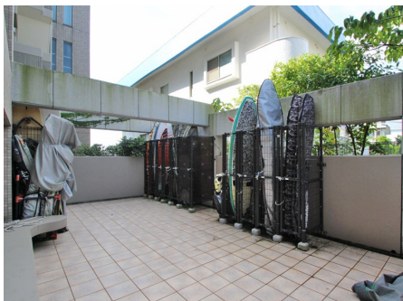
サーフボード置場