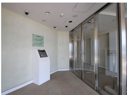
オートロック玄関