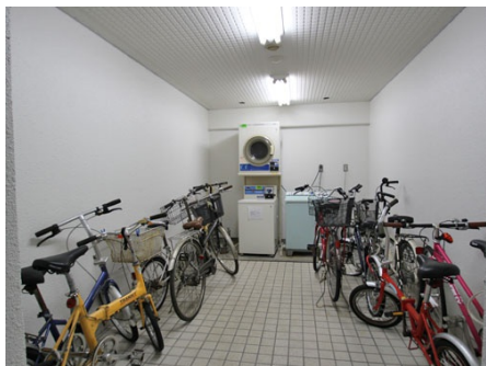
駐輪場兼ランドリールーム