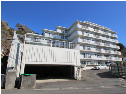
屋内駐車場と外観