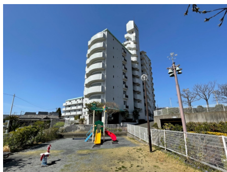
隣接する公園と外観