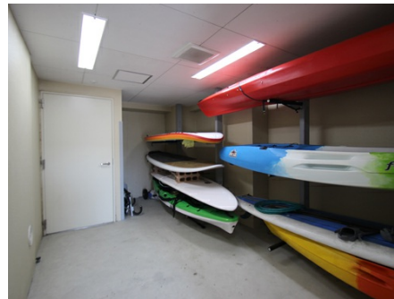
ペット用シャワー室