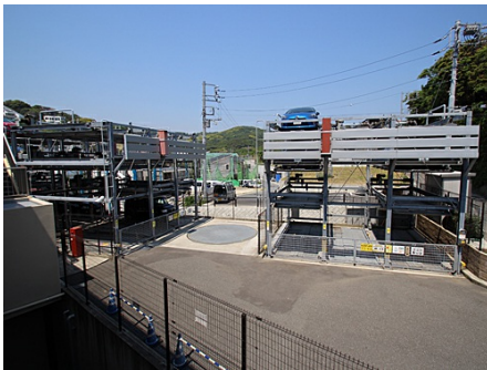
ロングボード等置場